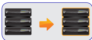
1. Crie uma imagem de backup ShadowProtect de um servidor Exchange