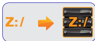
2. Atribua uma letra à imagem de backup ShadowProtect